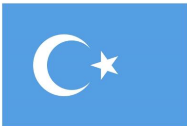
قېنىق كۆك #559EE2

مۇھاجىرەتتىكى شەرقىي تۈركىستان تەشكىلاتلىرى ۋە ئۇيغۇر ئاكتىپ پائالىيەتچىلىرى بايراق رەڭ كودى ئۆلچىمىدە تېخى بىرلىككە كېلىپ بولمىغاچقا، نامايىش ۋە مۇراسىملاردا ئىشلىتىلگەن بايراقلىرىنىڭ بىرى ناھايىتى سۇس ۋە يەنە بىرى ناھايىتى قېنىق رەڭدە بولۇپ قېلىپ، ئوخشاش بىر پائالىيەتتە كۆك رەڭلىك بايراقلىرىمىز رەڭ جەھەتتە بىر-بىرىدىن رۇشەن پەرقلىنىپ، چەتئەللىكلەر ۋە دۈشمەن تاجاۋۇزچى خىتاي ئالدىدا ئوڭايىسىز بىر ئەھۋال شەكىللەنمەكتە.