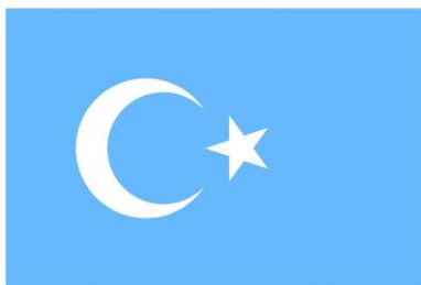
سۈزۈك كۆك #65B7FF