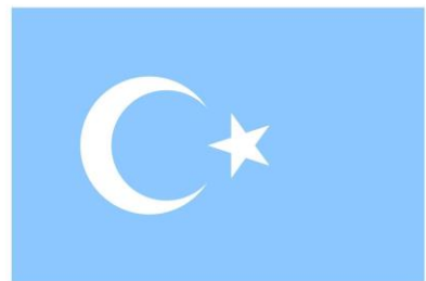
سۇس كۆك #8BC8FF

رەسىم - 3: رەڭ كودلىرى پەرقلىق بولغان شەرقىي تۈركىستان بايراقلىرىنىڭ سېلىشتۇرمىسى